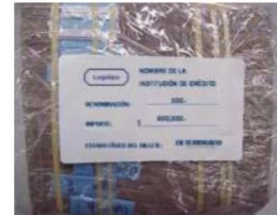
Ejemplo de Etiqueta de Identificación