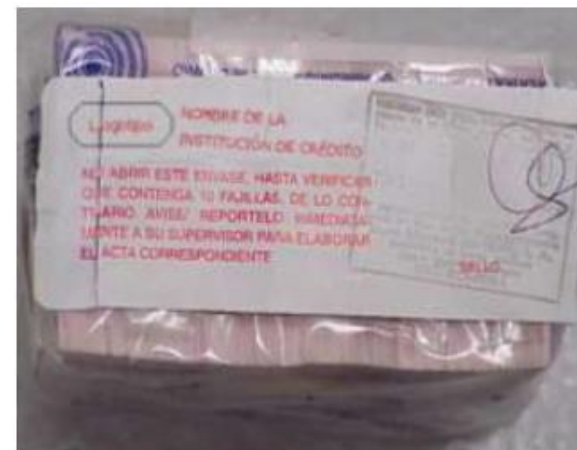
Ejemplo de etiqueta de mazo