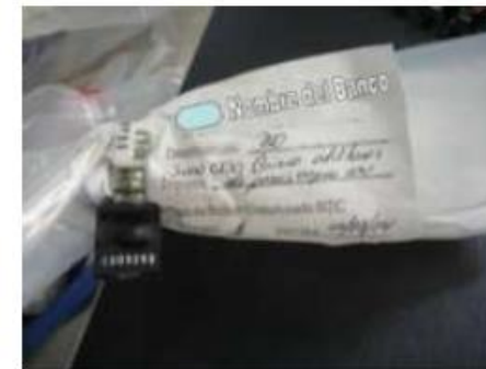
Ejemplo de etiqueta sujeta con sello